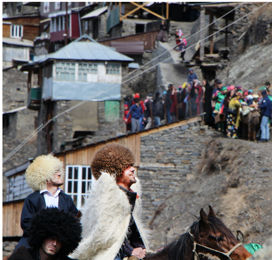
• Жених направляется к невесте • с. Тинди, Цумадинский район

В четвертую пятницу месяца зимы устраивали свой «Къаба» чабаны. Они, как правило, резали барана, приносили бузу и пировали, время от времени перемежая застолье с исполнением танцев и песен.