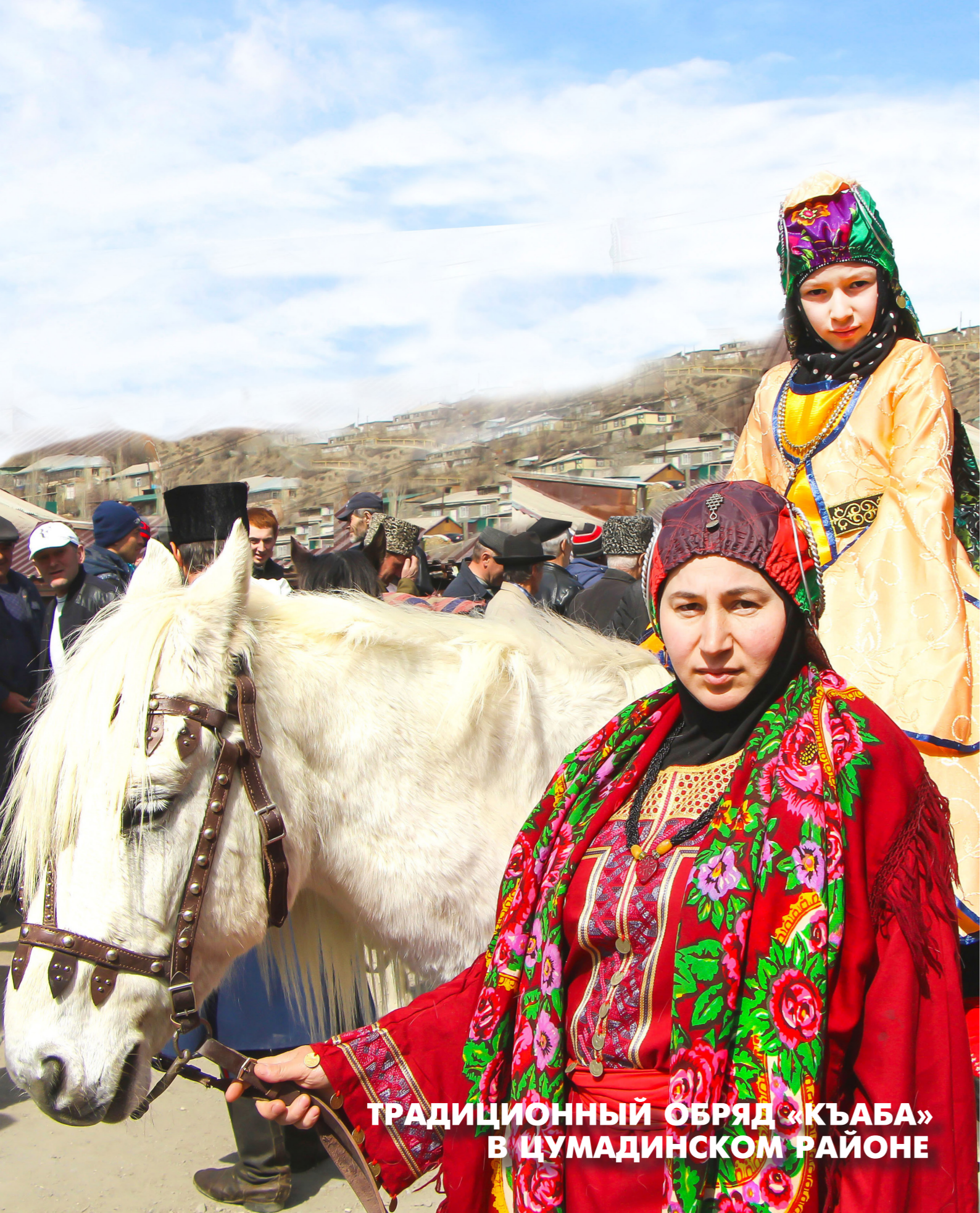
ТРАДИЦИОННЫЙ ОБРЯД «КЪАБА» В ЦУМАДИНСКОМ РАЙОНЕ

Старинные дома, мечеть, сохранившаяся с 17 в., местная водяная мельница, великолепие природы – это не все достопримечательности древнего Тинди. «Къаба» - старинный обрядовый зимний праздник, олицетворяющий скорое пробуждение природы - вот, чем еще дорожат тиндинцы.