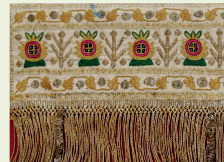
Иммаева Хадижа (1948 г.р.) «Подзор под каз» 1978г., Хлопок, золотая шелковая нить, гладь, тамбур, 255x75