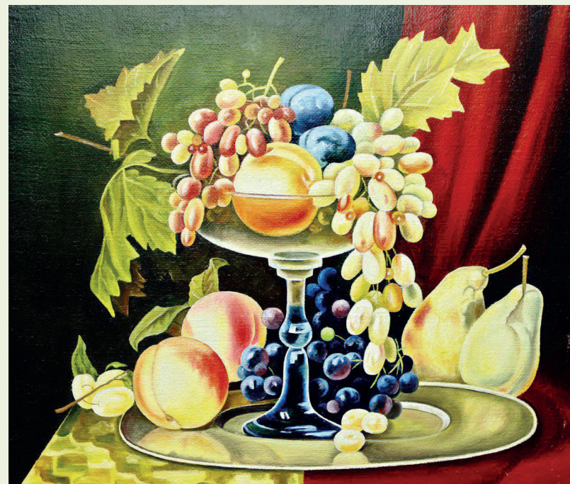
«Натюрморт с виноградом», 2014г., холст, масло, 60x71

Зарема Бутаева Министр культуры Республики Дагестан