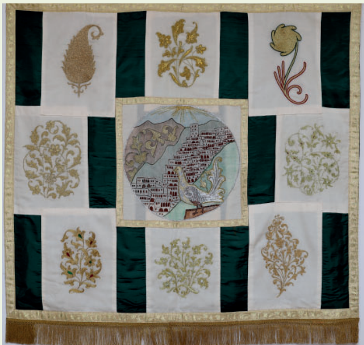
«Аул Кубачи» (коллективная работа преподавателей школы искусств). 2016 г. Шелк, маркизет, золотая и шелковая нить, мулине, гладь, тамбур, аппликация, 102x114