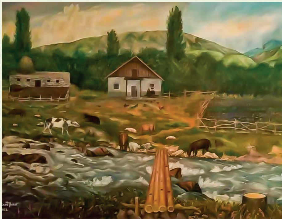
«На даче», 2002г., холст, масло, 73x103