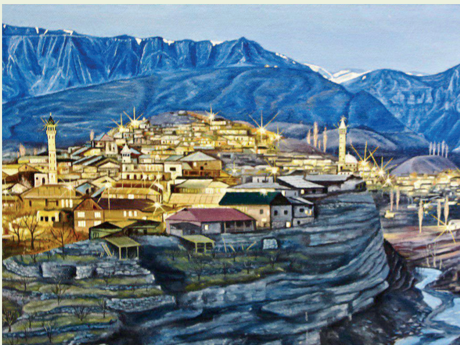
«Предвечерний Ботлих», 2012г., холст, масло, 98х65