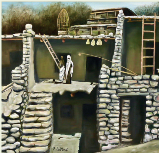
«Старый дом» 2005 г., холст, масло, 60x80