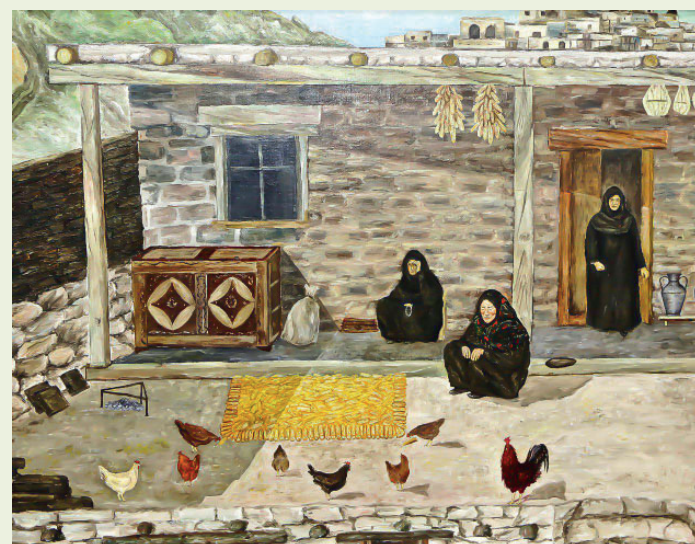
«Муники», 2002г., картон, масло, 65x85